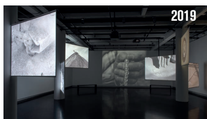
Yasmina Benabderrahmane, vue de l'exposition - La Bête, un conte moderne . 2020 © ADAGP, Paris, 2021