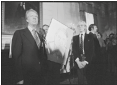
© J. Carter with A. Warhol during a reception for inaugural portfolio artists, 1977