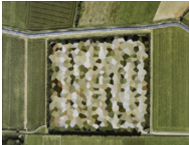
© Mishka Henner, NATO Storage Annex, Coevorden, Drenthe, 2011

Les formations thématiques ERSILIA vous permettent d'aborder, par le prisme de l'art, des enjeux politiques et sociaux en manipulant concrètement les outils offerts par la plateforme. Comment s'emparer des clés d'analyse et comment les transmettre à vos élèves ? Inscrivez-vous !