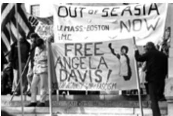
© Vietnam anti-war demonstration "out of s.e. asia now" "free angela davis!" "Boston common, boston, 1970