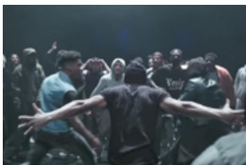
© Clément Cogitore, Extrait des Indes Galantes, 2017