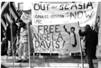
© Vietnam anti-war demonstration "out of s.e. asia now" "free angela davis!" Boston common, boston, 1970